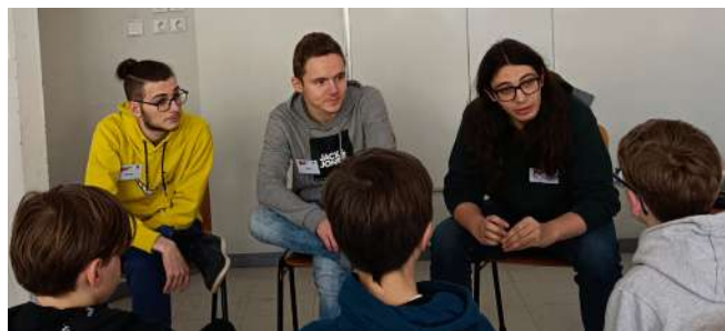
Les étudiants renseignent et accompagnent les écoliers durant diverses activités ludiques

Pour poursuivre leurs actions, les étudiants ont eu pour mission d'encadrer les activités et d'accompagner les écoliers les jeudi 29 février et 7 mars après-midis.